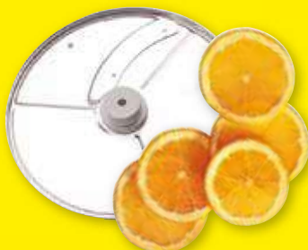
Plátkovač 3 mm