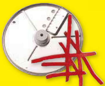
Julienne 4 x 4 mm