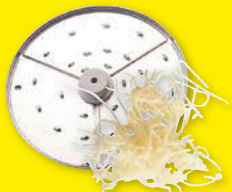
Strouhač 1,5 mm