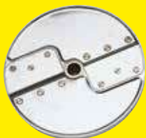
Julienne 4 x 4 mm Ref. 28052