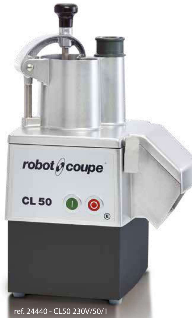
ref. 24440 - CL50 230V/50/1