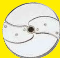
Plátkovač 1 mm Ref. 28062