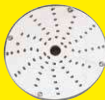
Strouhače 1,5 mm Ref. 28056