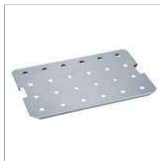
Falešné dno pro vaření/ udržování v GN na dně pánve