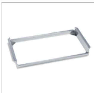
Závěsný rám pro použití GN