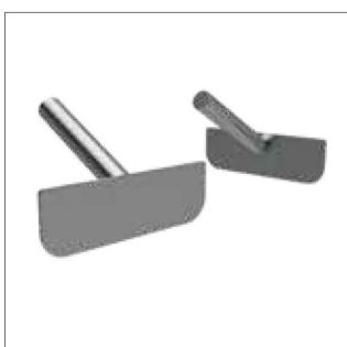
Stěrka/kopisto pro míchání potravin v pánvi