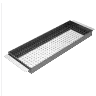
Sítko (na přípravu kapání do polévky)