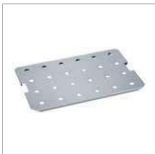
Falešné dno pro vaření/ udržování v GN na dně pánve