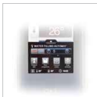
Funkce automatického plnění vody s přesností na 1 litr