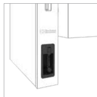
Oplachová integrovaná sprcha

Další příslušenství, PNC a ostatní detaily najdete v ceníku ProThermetic příslušenství.