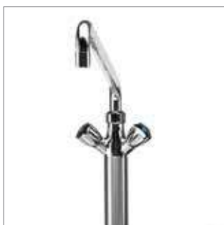
Napouštěcí směšovací baterie